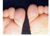
Juvenile plantar dermatitis